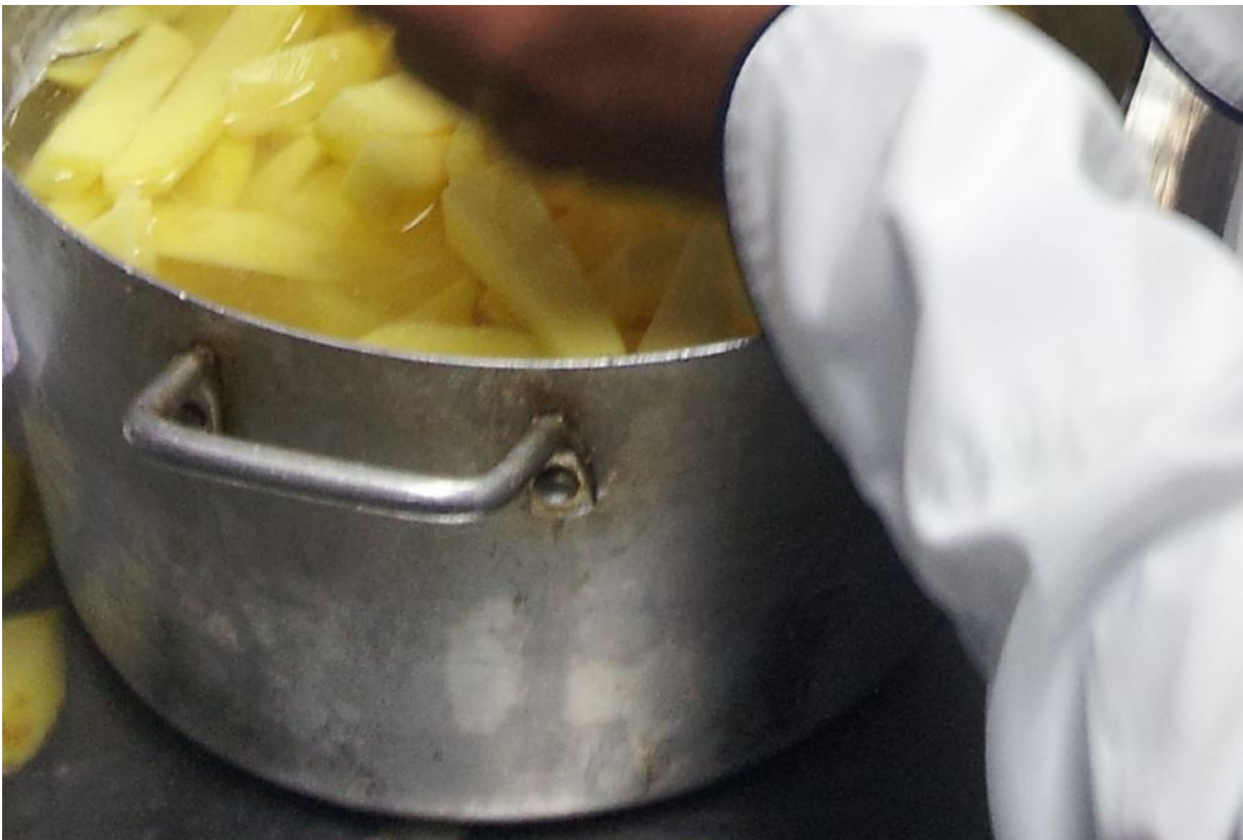
Embajadores de la Unión Europea visitan proyectos de desarrollo de CESAL y AVSI en Picoazá, Ecuador