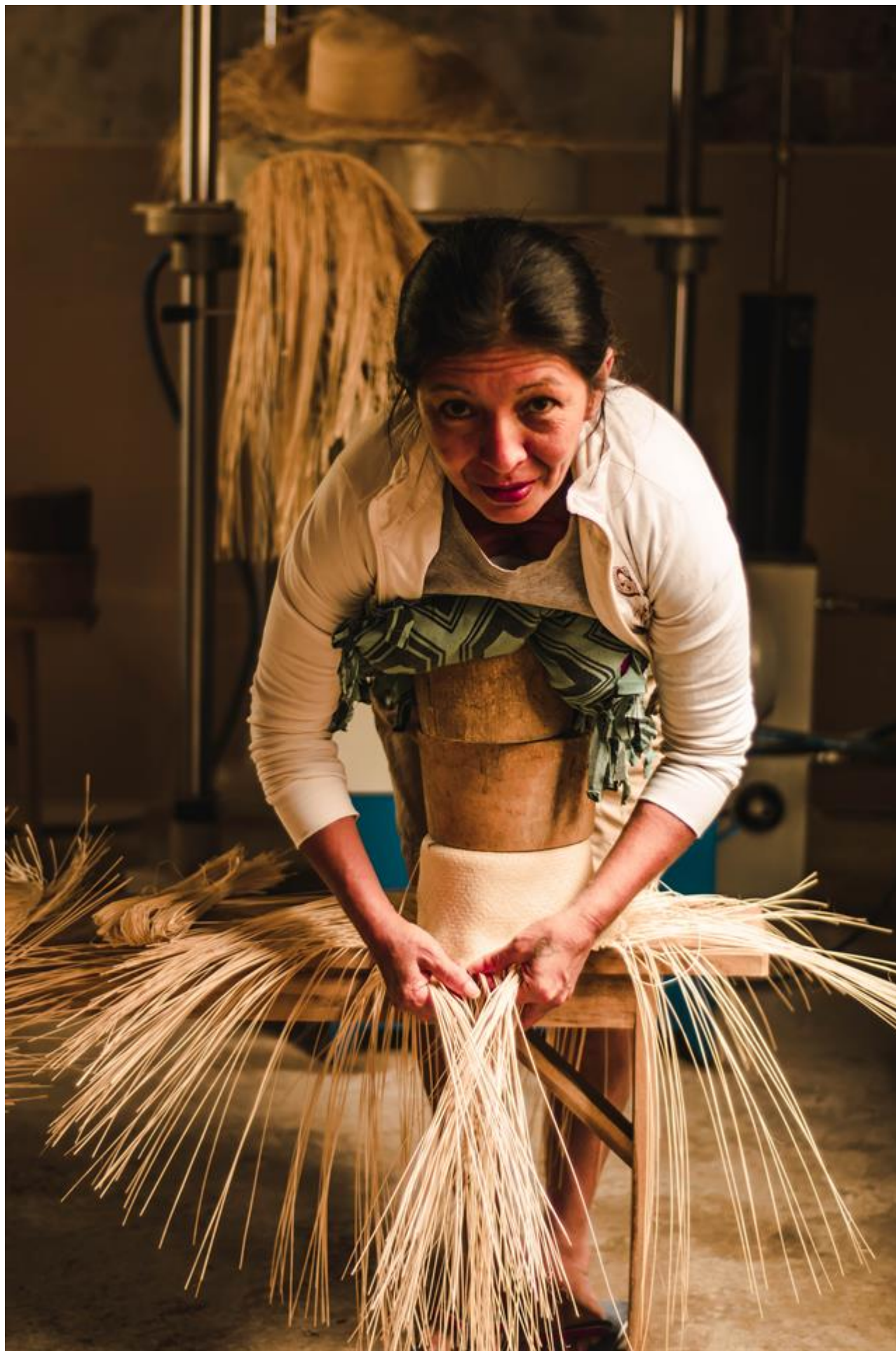
El Gobierno ecuatoriano visita el proyecto 'Tejiendo Redes' de CESAL