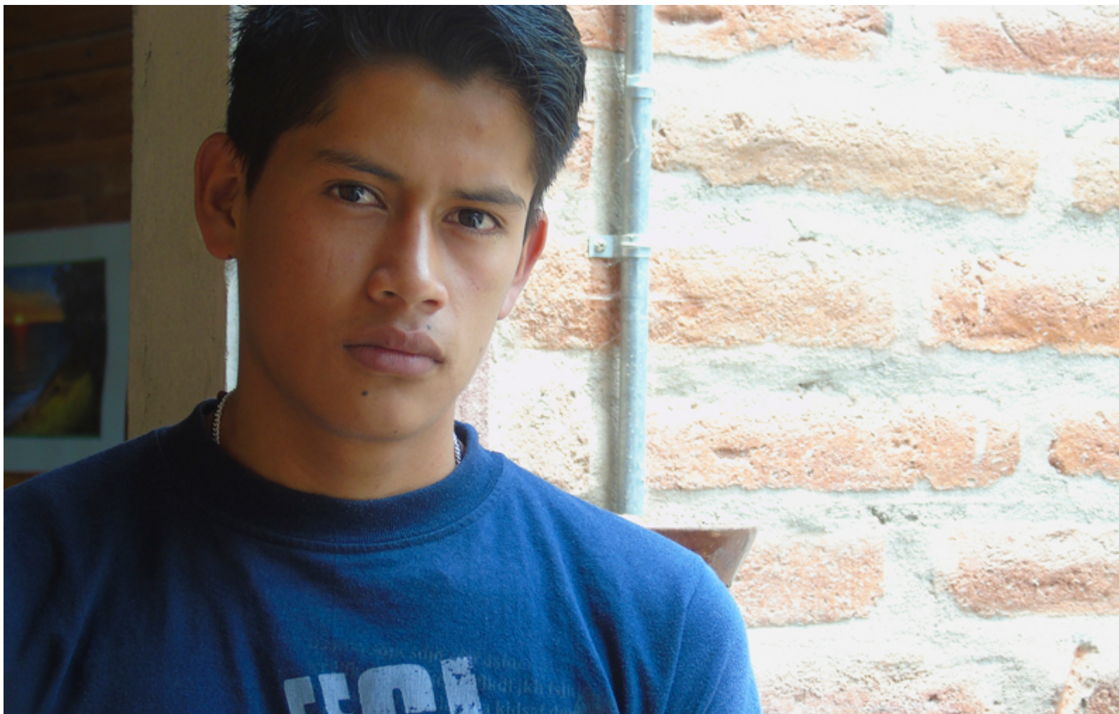
Telecomunicaciones. Quito, Ecuador.