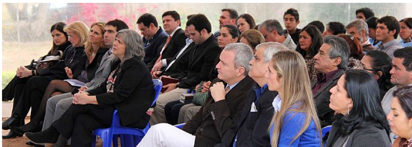
De la cárcel a la escuela en Paraguay

Más de un centenar de jóvenes, niños y niñas en conflicto con la ley y en situación de riesgo de exclusión socioeconómica tendrán, a partir de ahora, la oportunidad de formarse y educarse para lograr su reinserción social y laboral. Esto será posible gracias al Centro de Desarrollo Comunitario Luigi Giussani en Paraguay , inaugurado esta semana en la comunidad de Itaguá, a 30 km. de Asunción.